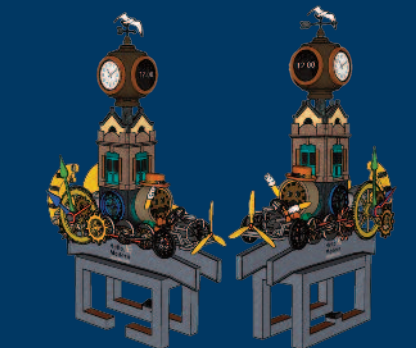
GUNSAN TIME TRAVEL time machine clock tower